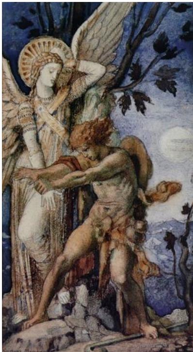
Gustave Moreau 1826 – 1898 Jakob en de Engel 1878 Musée national G. Moreau